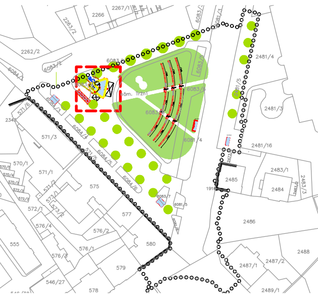
SCHÉMA POZICE VÝŘEZU M 1:000

POZNÁMKY: POZN. 01 legenda povrchů materiálů je pouze orientační. POZN. 02 situační výkresy PD D.1.1.700 nenahrazují celkovou koordinační situaci, slouží pouze pro orientační účely a vytyčení objektů.